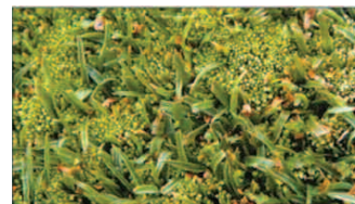
70%~80% Infested turf