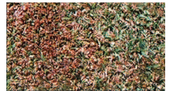
4-6 days after Moss Buster™ application