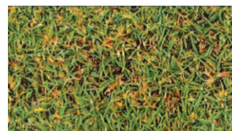
10-14 days after Moss Buster™ application